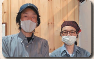
移住して起業! きっかけになった話が聞けるかも。