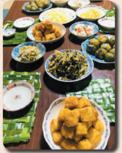
地元の料理を食べながら 地元の方の話を たくさん聞きましょう。